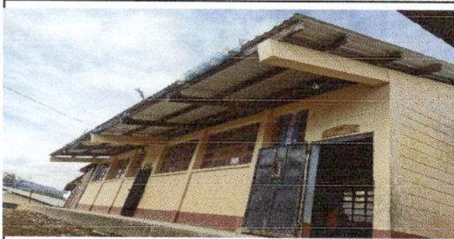
Foto 3: Sustitución de vidrio de la ventana de 1 puerta - Módulo II