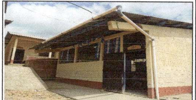
Foto 4: Pintura de muros exteriores e interiores y de puertas - Módulo II